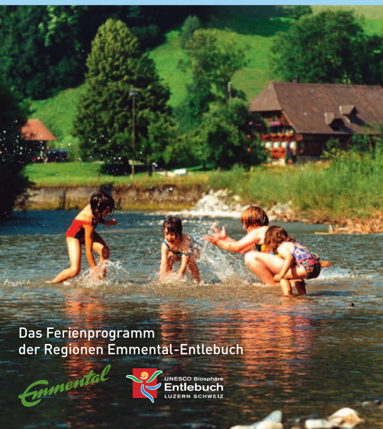
Das Ferienprogramm der Regionen Emmental-Entlebuch